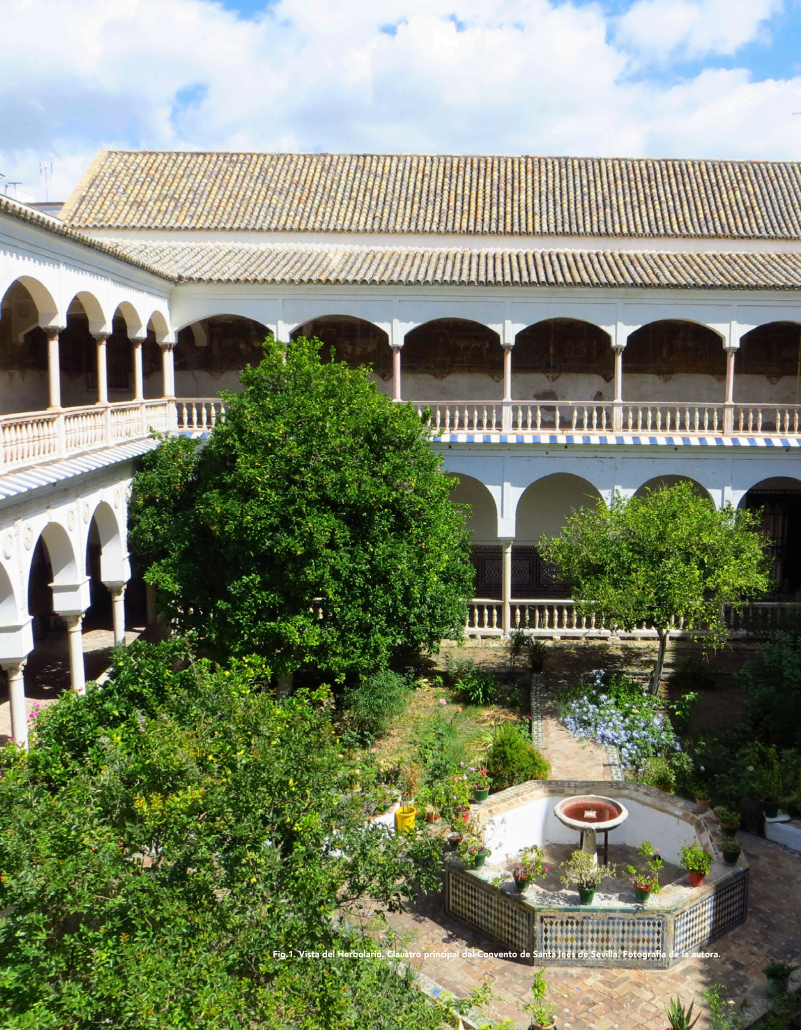
Fig. 1. Vista del Herbolario, Claustro principal del Convento de Santa Inés de Sevilla.