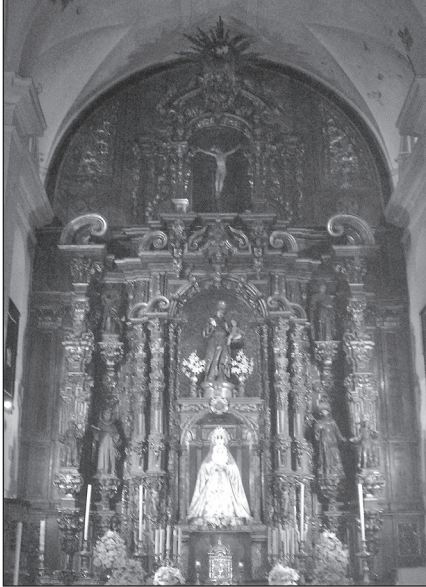
Retablo mayor de San Antonio