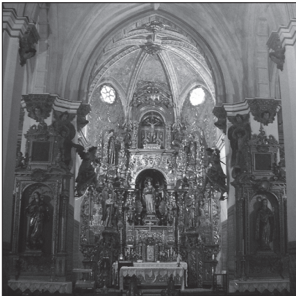
Retablo mayor de Santa Inés