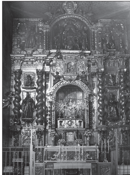
Retablo mayor Santa María de Jesús